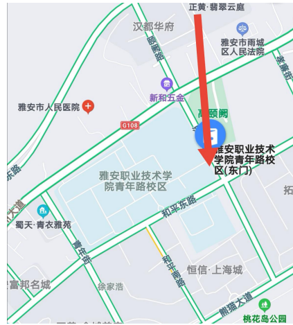
青年路校区返校入口