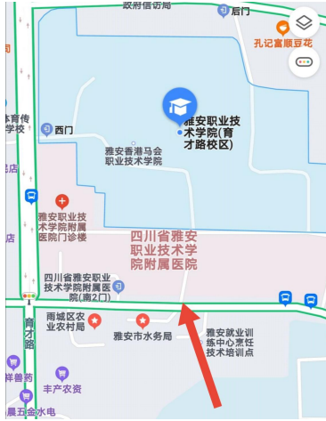
育才路校区返校入口