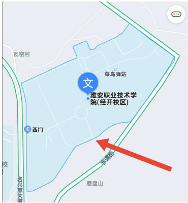
经开区校区返校入口